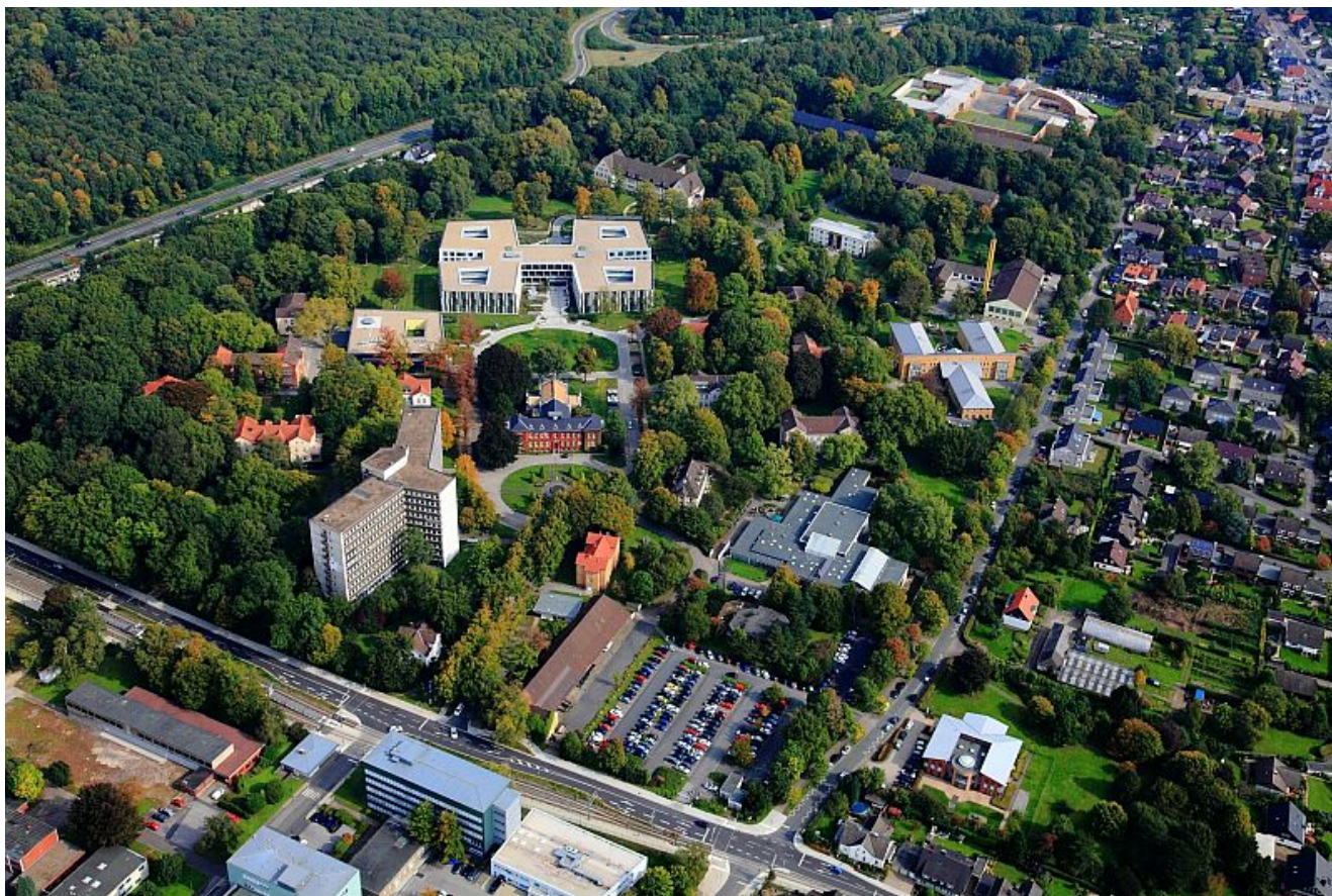
LWL-Klinik in Dortmund.