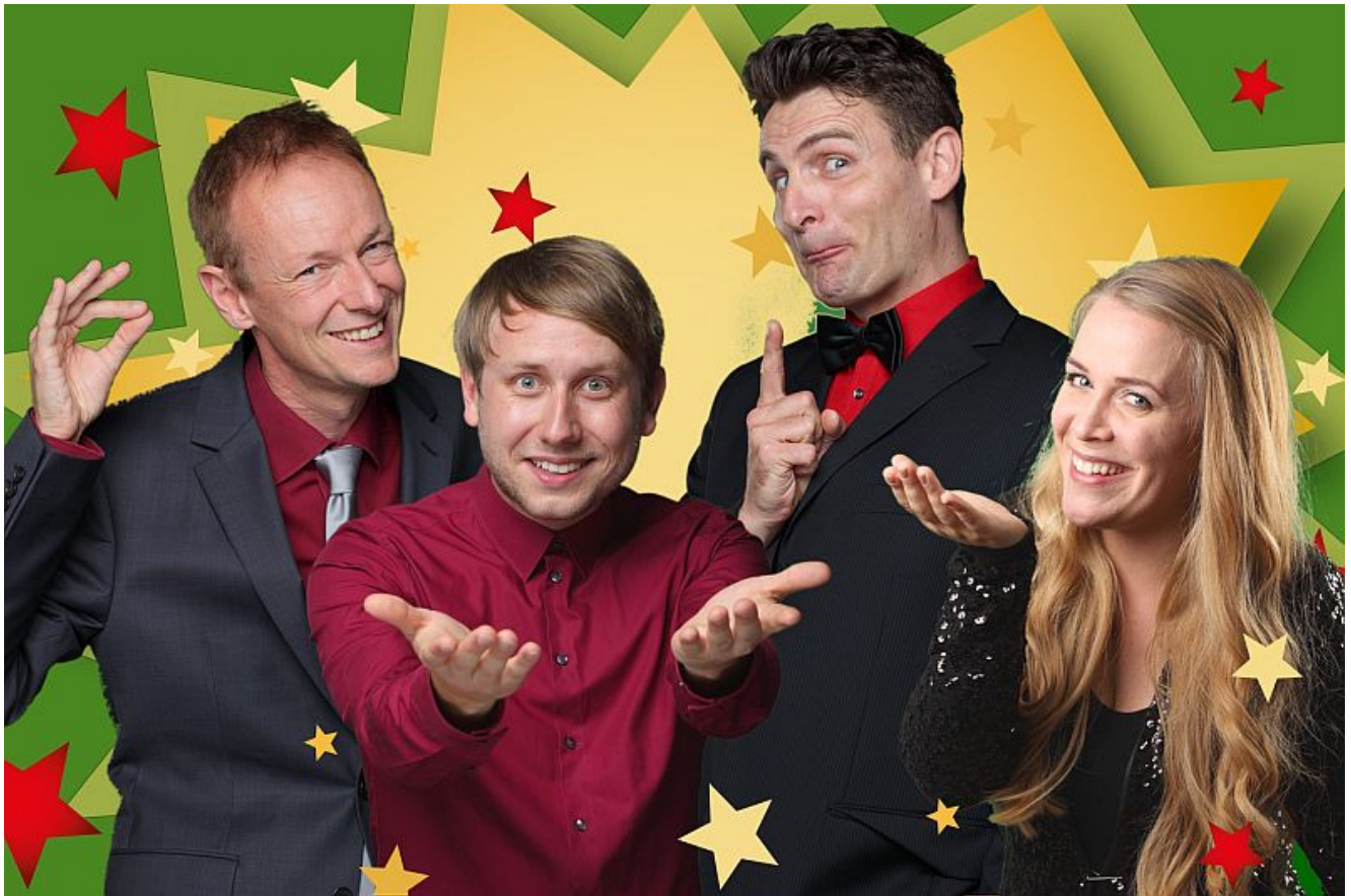
Improvisationstheater Springmaus.

Bei der neuen Springmaus Weihnachtsshow am Freitag, 2. Dezember, um 20.00 Uhr im studio theater bergkamen, geht es nicht weniger spektakulär zu, als wenn die heiligen drei Könige auf einer schneebedeckten Tanne sitzend den Kahlen Asten herunter rasen.