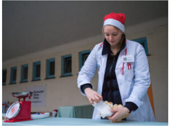
Premiere für die Teddybärenklinik.

Der Nikolaus kam nach zwei Jahren Abstinenz auch endlich wieder vorbei. Neu war diesmal der Tennisverein, der mit Tennisschläger und riesigen Bällen am Netz aus Holz eine ganz neue Tennisvariante zum Ausprobieren anbot. Ebenfalls zum ersten Mal dabei: Das Rote Kreuz mit einem Teddybärenkrankenhaus. Hier konnten alle genau beobachten, wie kleine und größere Blessuren behandelt werden. Direkt daneben ein Stand, der darüber informierte, was im Falle eines waschechten Blackouts samt Stromausfall zu tun ist. Was bedeuten die Sirenen-Alarme genau? Was sollte jeder an Vorräten im Keller haben, um eine gewisse Zeit zu überbrücken?