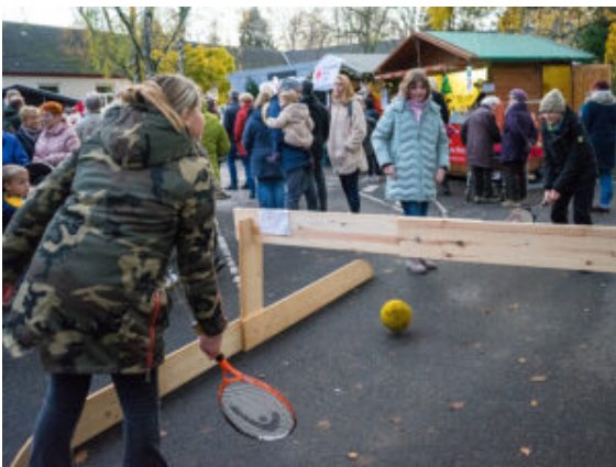
Etwas andere Variante des Tennis.

Der Nikolaus kam nach zwei Jahren Abstinenz auch endlich wieder vorbei. Neu war diesmal der Tennisverein, der mit Tennisschläger und riesigen Bällen am Netz aus Holz eine ganz neue Tennisvariante zum Ausprobieren anbot. Ebenfalls zum ersten Mal dabei: Das Rote Kreuz mit einem Teddybärenkrankenhaus. Hier konnten alle genau beobachten, wie kleine und größere Blessuren behandelt werden. Direkt daneben ein Stand, der darüber informierte, was im Falle eines waschechten Blackouts samt Stromausfall zu tun ist. Was bedeuten die Sirenen-Alarme genau? Was sollte jeder an Vorräten im Keller haben, um eine gewisse Zeit zu überbrücken?