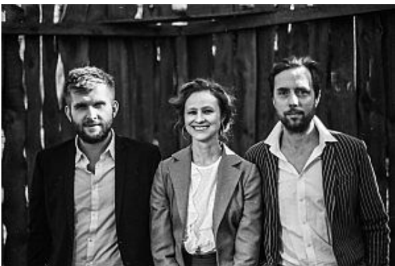
WoWaKin Trio.

USA Clubtournee, Europa Tournee und Festivals haben in den letzten Jahren für Furore gesorgt. Zahlreiche Auszeichnungen unterstreichen seinen Erfolg. Die siebenköpfige Band spielt hauptsächlich eigene Songs, vorwiegend einen Mix aus Funk, Soul, Rock und natürlich einen ordentlichen Schuss Blues. Dieser Mix geht "S"chneller in die Beine als man/Frau denkt.