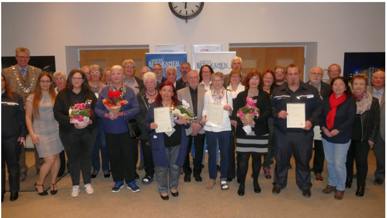
Ehrenamtsehrung im Bergkamener Bayer-.Werk