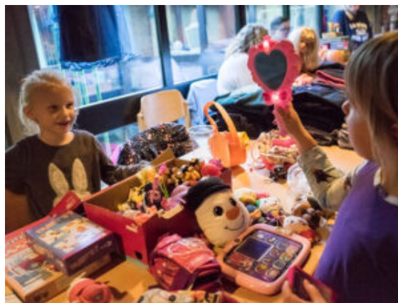
Spielzeug kommt gut an.

auch leidenschaftliche Freunde der Kirche hatten fast 30 Tische mit Spielzeug, Kinderkleidung und kreativen Eigenkreationen für einen bunten Basar bestückt. Kuchen, Speisen und Bratwürsten aus den Händen der Konfirmanden sowie Standgebühren gingen als Spende an die Ukraineflüchtlinge.