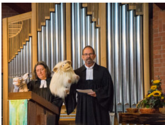
Die ungewöhnlichen Gottesdiensthelfer im