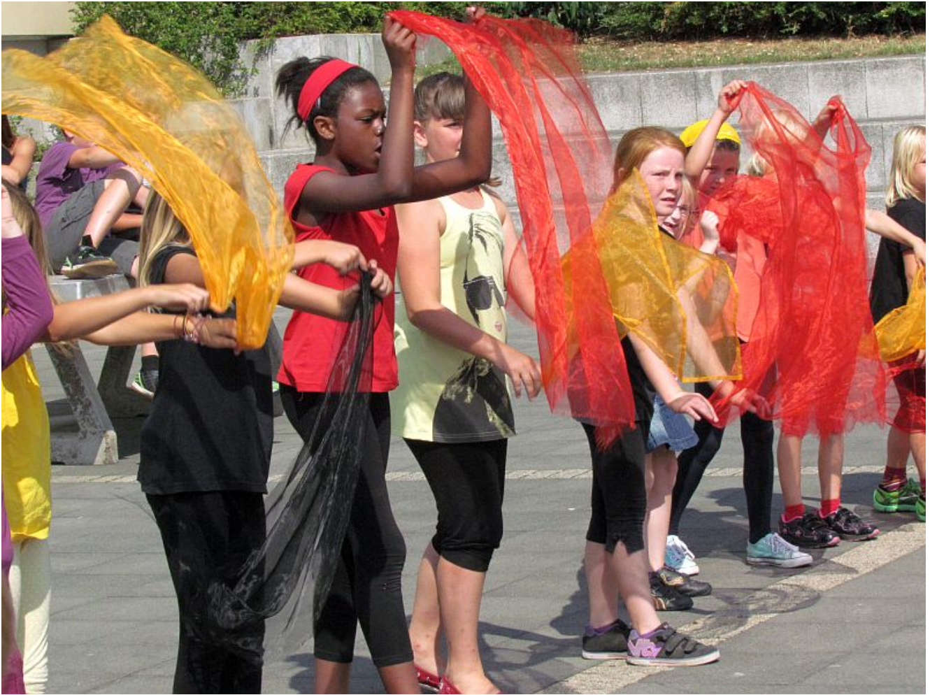
Foto von den KinderKulturTagen aus dem Archiv.

Die Bezirksregierung Arnsberg hat für die Kulturregion Hellweg gleich sieben Förderbescheide in Höhe von insgesamt rund 224.000 Euro ausgestellt. Davon profitiert unter andere die Sommerferienaktion der Bergkamener Jugendkunstschule (Wir sind draußen / KinderKulturTage). Die Projekte werden im Rahmen des Regionalen Kultur Programms NRW (ehemals Regionale Kulturpolitik NRW) gefördert.