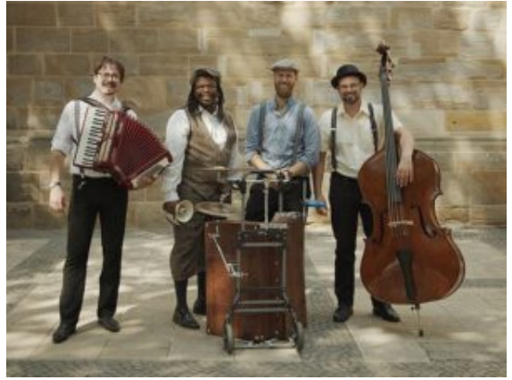
Die LasPolkas-Band sorgt am 30. April für Stimmung

Nach den vielen abgesagten Festen und Feierlichkeiten in der Corona-Pandemie hat die Vereinsgemeinschaft um „Wir in Weddinghofen e.V.“ am 30.04.22 die Veranstaltung „Weddinghofen feiert“ ins Leben gerufen und organisiert. Beteiligte Organisationen sind u.a. Wir in Weddinghofen e.V., Alevitische Gemeinschaft Kreis Unna, BKE Stadtverband Bergkamen, Siedlergemeinschaft an der Landwehr e.V., SPD Weddinghofen-Heil, Kleingartenverein Krähenwinkel e.V., Feuerwehr, Kindergarten Grüner Weg, Förderverein der Pfalzschule.