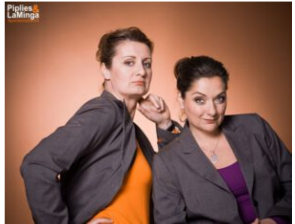
Damen-Doppel Piplies und La Minga.

fließend. Seine Texte beinhalten meist Themen wie Gerechtigkeit, Frieden, Gleichheit, Vielfalt, Revolution und Freiheit.