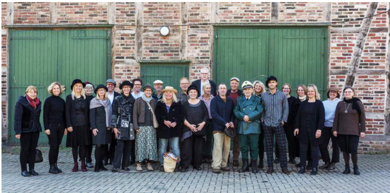
Die Schauspieler*innen des Musikfilms Astoria.

Der Musikfilm ‚Astoria‘, den der Kamener Chor ‚Die letzten Heuler‘ produziert hat, ist fertig und erlebt bald seine Premiere. In Anwesenheit der Schauspieler, des Regisseurs und des Film- und Ton-Teams wird er am 12. Februar ab 20 Uhr am Ort seiner Entstehung, in der Ökologiestation in Bergkamen-Heil , gezeigt. Im ersten Teil des Programms werden die ‚Heuler‘ und die Combo ‚Die wilde 7‘ live den zweiten Teil ihres ‚jung und wild‘ Konzertes vom 31. Oktober letzten Jahres musizieren. Nach der Pause wird dann der 42-minütige Musikfilm gezeigt, dessen Produktion mehr als 16.000 Euro gekostet hat und der nur mit Hilfe großzügiger Sponsoren und erheblich reduzierter ‚Freundschaftsgagen‘ der bekannten Schauspieler möglich wurde.