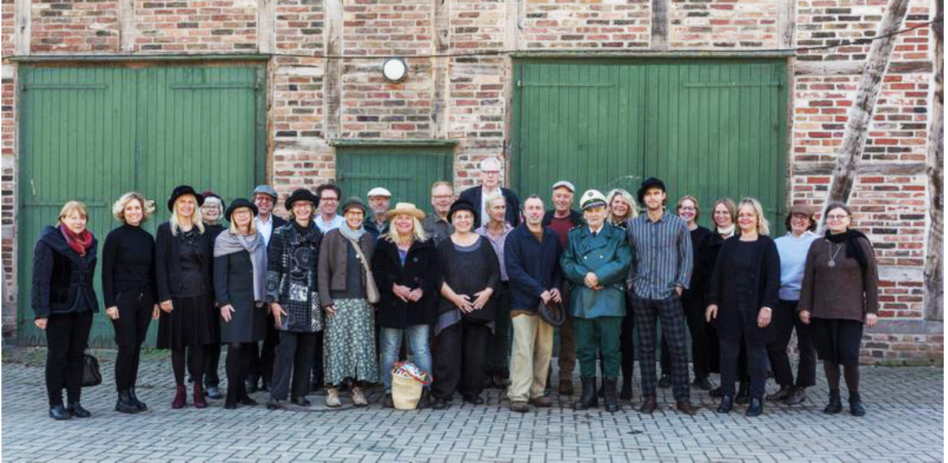
Die Schauspieler*innen des Musikfilms Astoria.

Der Musikfilm ‚Astoria‘, den der Kamener Chor ‚Die letzten Heuler‘ produziert hat, ist fertig und erlebt bald seine Premiere. In Anwesenheit der Schauspieler, des Regisseurs und des Film- und Ton-Teams wird er am 12. Februar ab 20 Uhr am Ort seiner Entstehung, in der Ökologiestation in Bergkamen-Heil , gezeigt. Im ersten Teil des Programms werden die ‚Heuler‘ und die Combo ‚Die wilde 7‘ live den zweiten Teil ihres ‚jung und wild‘ Konzertes vom 31. Oktober letzten Jahres musizieren. Nach der Pause wird dann der 42-minütige Musikfilm gezeigt, dessen Produktion mehr als 16.000 Euro gekostet hat und der nur mit Hilfe großzügiger Sponsoren und erheblich reduzierter ‚Freundschaftsgagen‘ der bekannten Schauspieler möglich wurde.