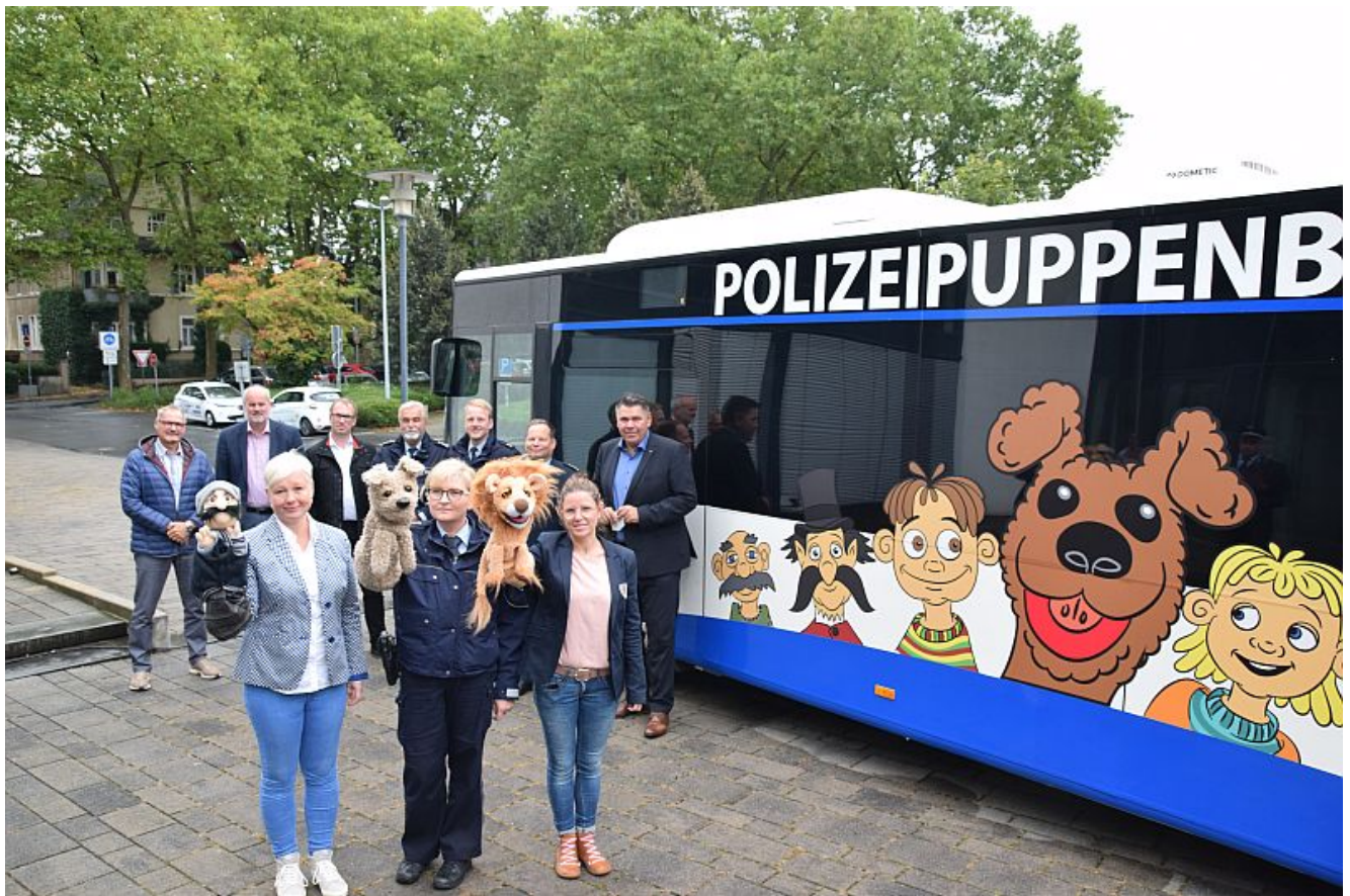
Das Team vor dem Puppenbus.

Im Jahr 1984 wurde zum ersten Mal im Kreis Unna ein Linienbus zur mobilen Polizeipuppenbühne umgebaut und mit unterschiedlichen Nachfolgern bis zum Beginn der Corona Pandemie eingesetzt. Jetzt hat Landrat und Behördenleiter der Kreispolizeibehörde Unna einen neuen Bus vorgestellt.