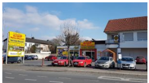
Derr alte Netto-Standort in Weddinghofen an der