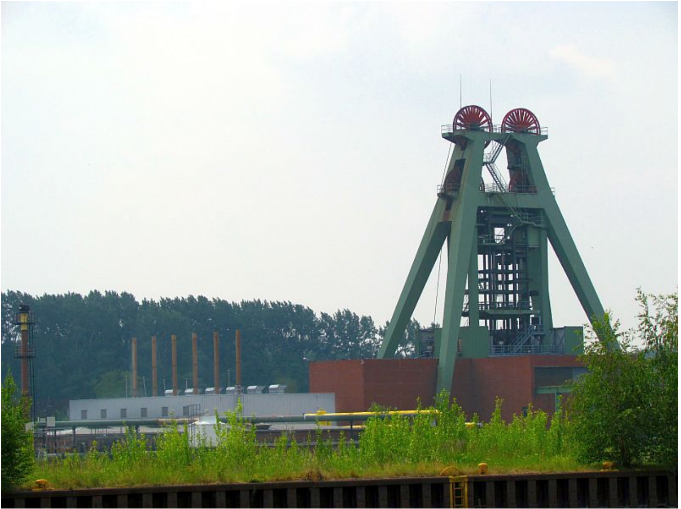
Das Schachtgerüst Haus Aden 2 .

Vielleicht schon ab Ende Februar wird das Schachtgerüst Haus Aden 2 aus dem Stadtbild verschwinden. Hier hat es die RAG eilig, denn bekanntlich soll auf dem Fundament des Förderturms die neue Wasserhaltung für das östliche Revier gesetzt werden.