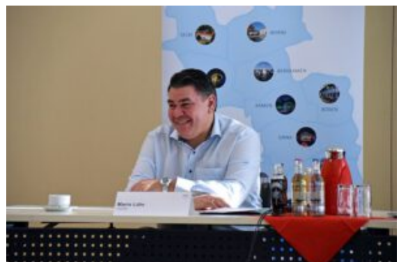
111 Tage im Amt: Landrat