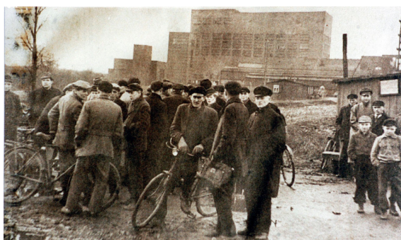
Wartende Menschen vor der Unglückszeche Grimberg 3/4.

Als die Rettungstrupps am Abend des dritten Tages aufgeben wollten, fanden sie schließlich weitere acht Überlebende. In der Nacht zum 24. Februar wurden sie über den Schacht Grillo in Kamen zu Tage gebracht. Zu den Todesopfern zählten auch drei Offiziere der britischen North German Coal Control (NGCC). Die Söhne englischer Bergwerksbesitzer interessierten sich damals für einen modernen Kohlehobel, der auf Grimberg 3/4 eingesetzt wurde.