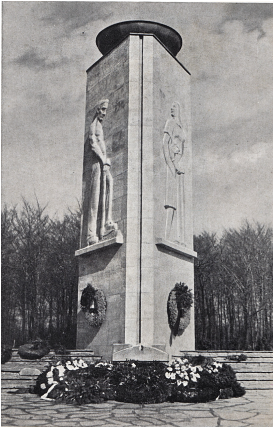
Mahnmal für das Grubenunglück

Genau sechs Jahre nach dem Unglück wurde am 20. Februar 1952 auf dem damaligen neuen Kommunalfriedhof in Weddinghofen (heute der Waldfriedhof am Südhang) das neun Meter hohe Mahn- und Ehrenmal eingeweiht. Der dreieckige Turm zeigt vorn links einen Bergmann, der sich auf einer Hacke stützt, und vorn rechts eine Bergmannsfrau, die tröstend ihr Kind hält. Auf der dem Wald zugewandten Rückseite sind die Namen aller Todesopfer eingemeißelt worden. Das Denkmal versinnbildlicht den Schachtturm, durch den die Bergleute eines Tages einfuhren und durch ein verheerendes Unglück überrascht wurden. Am Fuß des Turms befindet sich ein Sarkophag mit den Symbolen des