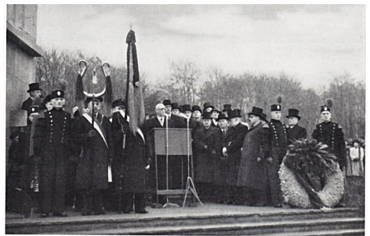
Einweihung des Ehrenmals auf dem Weddinghofer Waldfriedhof am 20. Februar 1952

Die Ursache der verheerenden Katastrophe ist bis heute nicht restlos geklärt. Immer noch kursieren Gerüchte über Sabotage. Der Betriebsrat von Kuckuck, wie die Schachanlage Grimberg 3/4 im Volksmund genannt wird, setzte eine Belohnung von 1000 Reichsmark für die endgültige Klärung des Unglücks aus. Als sicher anzusehen ist jedenfalls, dass eine Schlagwetterexplosion eine Kohlenstaubexplosion nach sich zog.