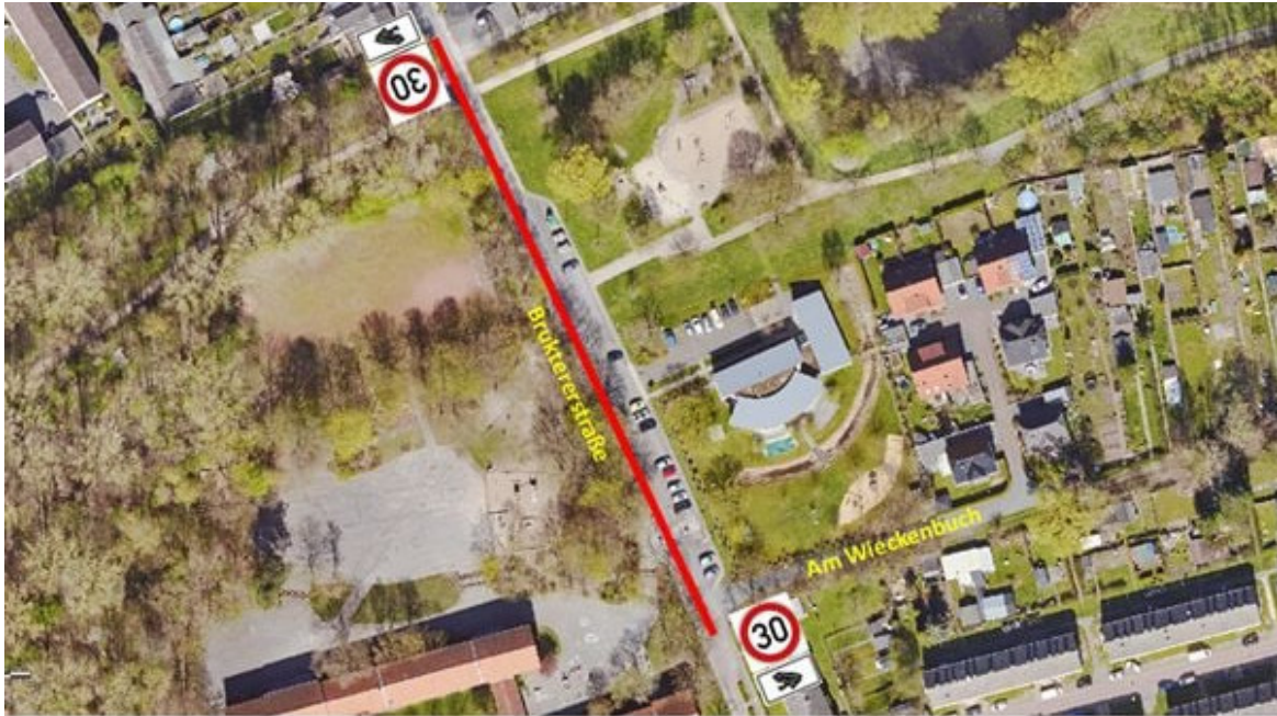
Abbildung 2 Bruktererstraße.

Folgende Straßenabschnitte werden ab kommender Woche (9. KW) bis ca. Mitte April entsprechend ausgeschildert: