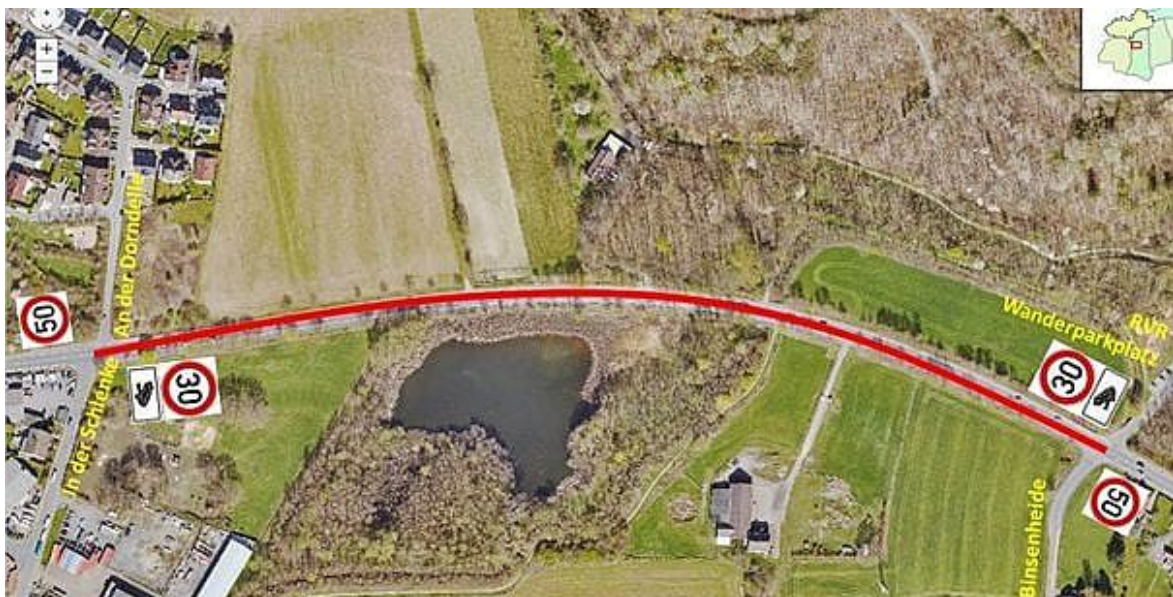
Abbildung 1 Erich-Ollenhauer-Straße.

Der aktuelle Wetterumschwung führt dazu, dass wir Menschen uns wieder vermehrt durch die Landschaft bewegen und unseren Alltag aktiver gestalten. Dieser durchaus positive Effekt ist aktuell jedoch nicht nur bei uns selbst zu beobachten. Frösche, Kröten und andere Amphibien werden als wechselwarme Tiere immer dann munter, wenn die Temperaturen am Ende des