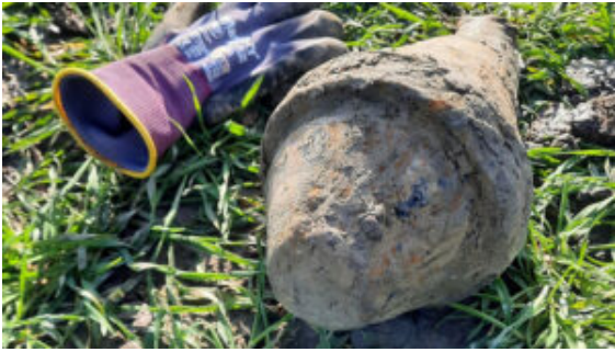
Treibladungskopf der Panzerfaust