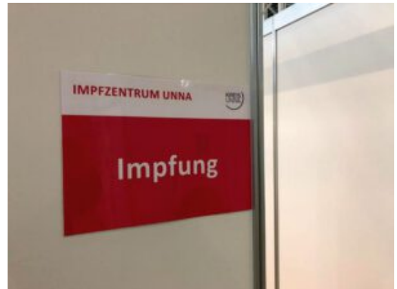
Das Impfzentrum des Kreises Unna in der Kreissporthalle II an der Platanenallee 20a in Unna.

Wie das NRW-Gesundheitsministerium beschlossen hat, können seit dem Wochenende auch alle Bürgerinnen und Bürger, die 1943 oder früher geboren sind, Impftermine im Impfzentrum über das Buchungsportal der Kassenärztlichen Vereinigung Westfalen-Lippe (KVWL) vereinbaren. Bisher war dies für die 79-Jährigen (und älter) möglich.