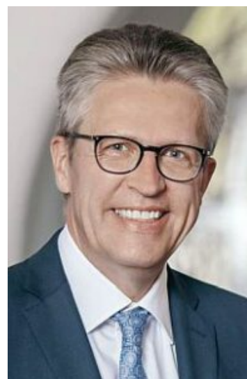
Bürgermeister Bernd Schäfer