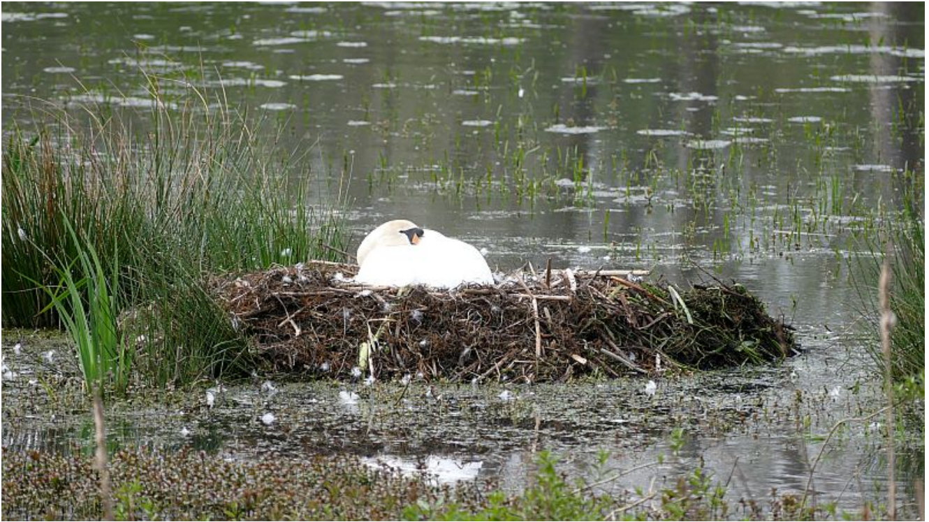
Schwanennest am Schwanenweiher.