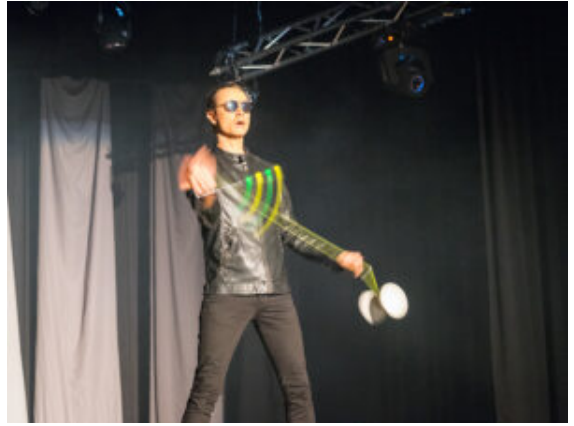
Coole Akrobatik mit dem Diabolo und dem Licht.

Das ist vor allem angesichts der schwierigen Bedingungen unter Corona mehr als beeindruckend. Kein Wunder, dass Rainer Maria Rilke quasi Schirmherr des Abends wurde und seine Weisheiten das fröhliche Treiben auf der Bühne nur noch betonten. „Tu was du nicht kannst“, lautete das Motto. Mutig sein, das ausprobieren, was hinter Hürden der Angst scheinbar unerreichbar ist. Den Schrecken und den Respekt als Herausforderung sehen und einfach sein Ding machen: Viele berühmte Persönlichkeiten im Foyer zeigten mit ihren Lebensläufen in einer kleinen Ausstellung, dass dies immer wieder klappen kann. Albert Einstein, Nikolaus Kopernikus, Bob Beamon: Sie sind nur einige, die mit Mut und Entschlossenheit neue Wege geebnet haben.