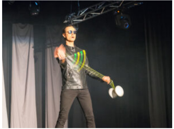
Cooler Akrobatik mit dem Diabolo und dem Licht.

Das ist vor allem angesichts der schwierigen Bedingungen unter Corona mehr als beeindruckend. Kein Wunder, dass Rainer Maria Rilke quasi Schirmherr des Abends wurde und seine Weisheiten das fröhliche Treiben auf der Bühne nur noch betonten. „Tu was du nicht kannst“, lautete das Motto. Mutig sein, das ausprobieren, was hinter Hürden der Angst scheinbar unerreichbar ist. Den Schrecken und den Respekt als Herausforderung sehen und einfach sein Ding machen: Viele berühmte Persönlichkeiten im Foyer zeigten mit ihren Lebensläufen in einer kleinen Ausstellung, dass dies immer wieder klappen kann. Albert Einstein, Nikolaus Kopernikus, Bob Beamon: Sie sind nur einige, die mit Mut und Entschlossenheit neue Wege geebnet haben.