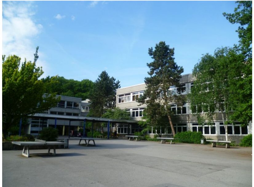
Schulhof des Gymnasiums.

Personell ebenso wie finanziell. Ein Schwerpunkt der laufenden Maßnahmen liegt auf der Digitalisierung. Sprich: auf der Anschaffung mobiler Endgeräte, der Anbindung an schnelles Internet und der Verkabelung innerhalb der Schulen, um die Voraussetzungen für moderne Unterrichtsformen zu schaffen und zu verbessern. Schäfer: „Bildung ist eine wesentliche Voraussetzung für soziale Teilhabe. Gleichzeitig trägt sie erheblich dazu bei, den Strukturwandel erfolgreich zu bewältigen. Der Ausstattung der Schulen gilt daher auch in Zukunft unsere volle Aufmerksamkeit.“