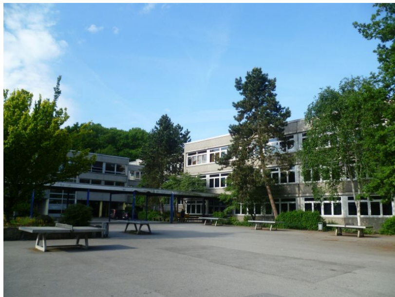
Schulhof des Gymnasiums.

Personell ebenso wie finanziell. Ein Schwerpunkt der laufenden Maßnahmen liegt auf der Digitalisierung. Sprich: auf der Anschaffung mobiler Endgeräte, der Anbindung an schnelles Internet und der Verkabelung innerhalb der Schulen, um die Voraussetzungen für moderne Unterrichtsformen zu schaffen und zu verbessern. Schäfer: „Bildung ist eine wesentliche Voraussetzung für soziale Teilhabe. Gleichzeitig trägt sie erheblich dazu bei, den Strukturwandel erfolgreich zu bewältigen. Der Ausstattung der Schulen gilt daher auch in Zukunft unsere volle Aufmerksamkeit.“