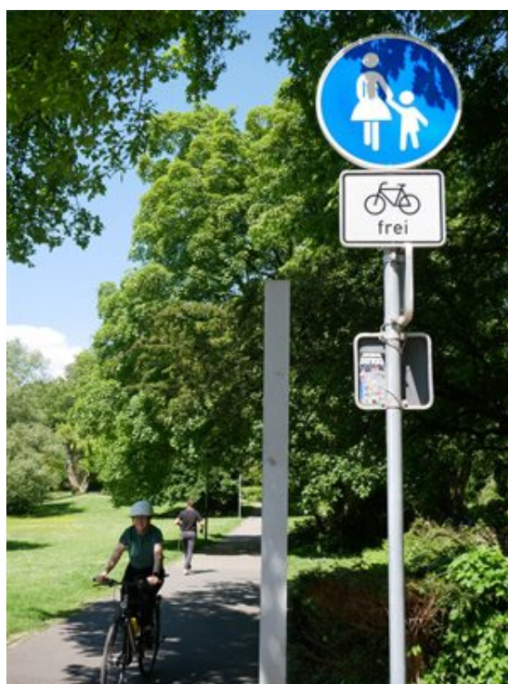
Rücksichtsvolles Miteinander auf einem gemeinsamen Fuß- und Radweg.

Noch strengere Vorschriften gelten auf Fußwegen mit dem Zusatz-Schild „Radfahrer frei“. Hier haben Fußgänger Vorrang, und Radfahrer müssen Schrittgeschwindigkeit einhalten und dürfen sich auf keinen Fall den Weg freiklingeln. „Eine Benutzungspflicht für diese Wege besteht für die Radler nicht. Sie können auch auf der Straße fahren und sollten dies im Interesse des Fußgängerverkehrs auch nach Möglichkeit tun“, unterstreicht Arnold.