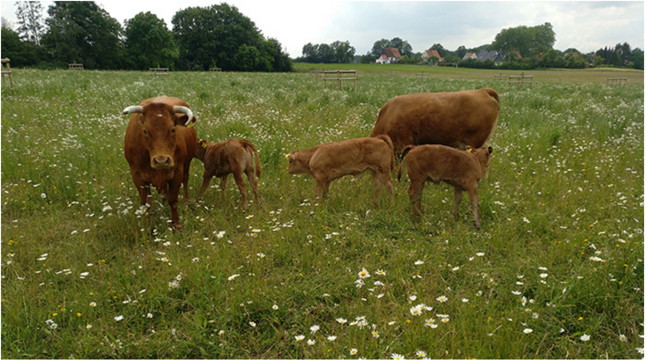
Die „Französinen“ des Bauers auf der Weide.