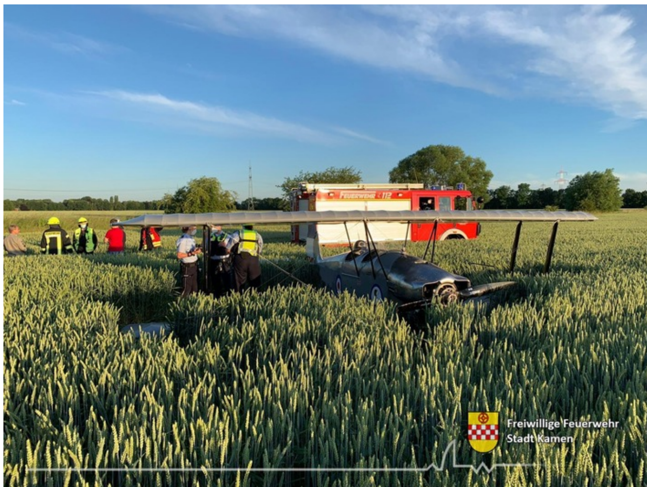
Flugunfall in Derne.

Gegen 5:30 Uhr wurde die Feuerwehr Kamen heute zu einem Feld an der Derner Straße alarmiert. Vor Ort war es zu einer Sicherheitslandung eines motorisierten Ultraleichtflugzeuges gekommen. Der Pilot hatte sich zuvor im Anflug auf den Flugplatz Kamen-Heeren befunden, als ihn offenbar ein technischer Defekt zu dieser Maßnahme zwang.