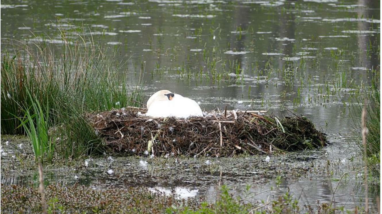
Schwanennest am Schwanenweiher.