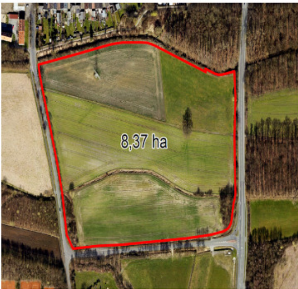
Lage: westl. Industriestr., nördl. „Am Romberger Wald“