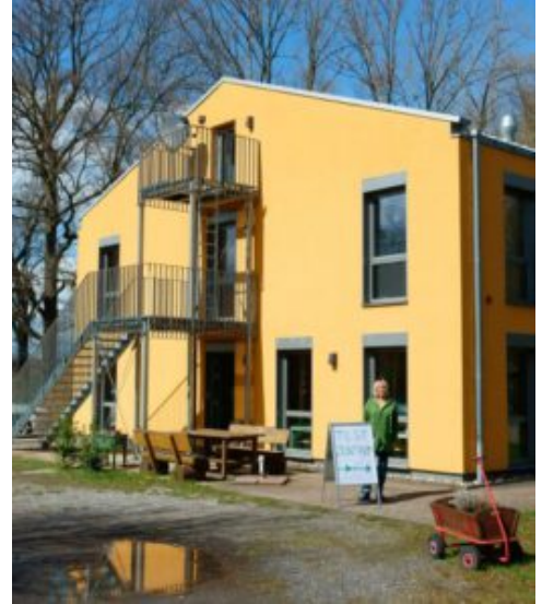
Gästehaus an der Ökologiestation.

„Schnelltestzentrum Ökologiestation im Gästehaus“ geht am Freitag, 16. April um 15 Uhr in Betrieb und bietet kostenfreie Schnelltests an. Die Pächter des „Gästehauses der Ökologiestation“ haben aus Ihrer Not, coronabedingt einen derzeit ungenutzten Veranstaltungsraum zu betreiben, eine Tugend zum Wohle und Schutz der Allgemeinheit gemacht.