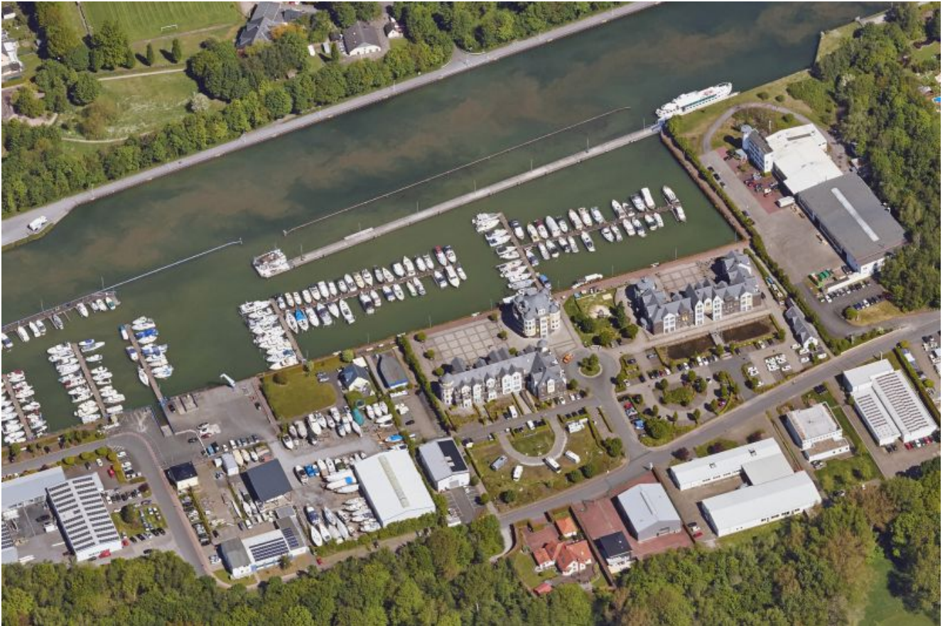
Marina Rünthe in Bergkamen am Datteln-Hamm-Kanal.

Das eigene Haus einmal von oben sehen – oder aus allen vier Himmelsrichtungen? Kein Problem mit dem 3D- und Schrägluftbildviewer des Kreises. Jetzt gibt es neue Fotos aus dem letzten Sommer, so lässt sich über die Jahre 2017, 2019 und 2020 sogar eine kleine Zeitreihe erschließen.