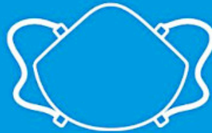
✓ FFP2 oder KN95/N95-Maske