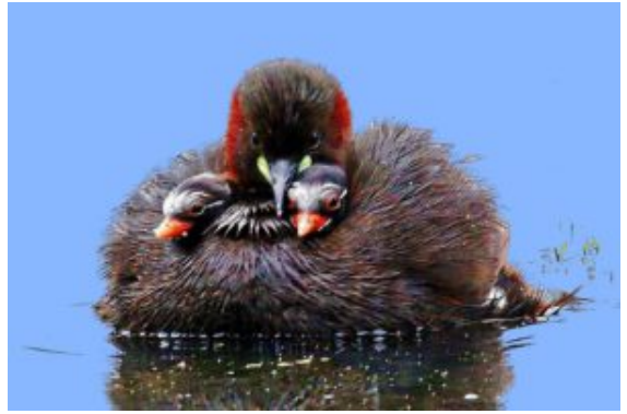
Zwergtaucher mit seinen Jungen.