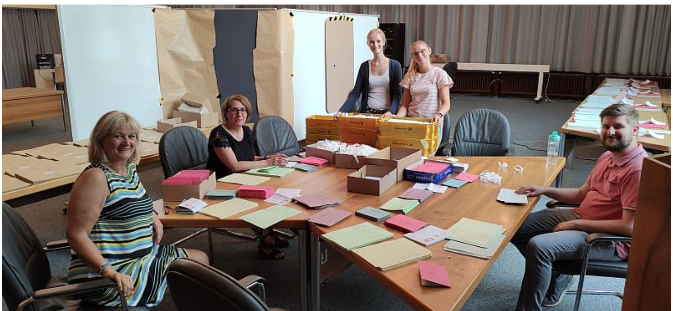
Das Briefwahlbüro im großen Ratssaal.