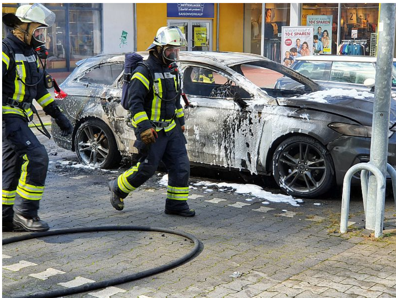
Kfz-Brand auf dem Parkplatz des Nordverg-Centers.