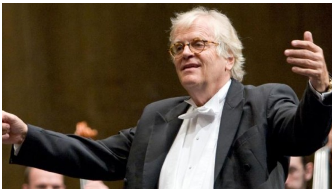
Professor Justus Frantz.

Veranstalter sind die Stadt Bergkamen und das Kulturreferat in Kooperation mit der Philharmonie