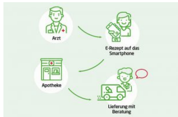
Der Weg des E-Rezepts.

Dazu bekommt der Patient künftig von seinem Arzt einen digitalen Code, in dem die Rezeptdaten verschlüsselt sind – entweder in Papierform oder zum Abspeichern auf dem Smartphone des Patienten. Zurzeit wird intensiv an der optimalen Lösung gearbeitet, darin fließen auch praktische Erfahrungen einiger lokal begrenzter Pilotprojekte ein – und auch über den Tellerrand wird geschaut: Denn in immerhin 13 anderen europäischen Ländern gehört das elektronische Rezept bereits zum Alltag.