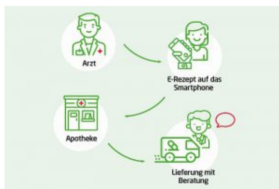
Der Weg des E-Rezepts.

Dazu bekommt der Patient künftig von seinem Arzt einen digitalen Code, in dem die Rezeptdaten verschlüsselt sind – entweder in Papierform oder zum Abspeichern auf dem Smartphone des Patienten. Zurzeit wird intensiv an der optimalen Lösung gearbeitet, darin fließen auch praktische Erfahrungen einiger lokal begrenzter Pilotprojekte ein – und auch über den Tellerrand wird geschaut: Denn in immerhin 13 anderen europäischen Ländern gehört das elektronische Rezept bereits zum Alltag.