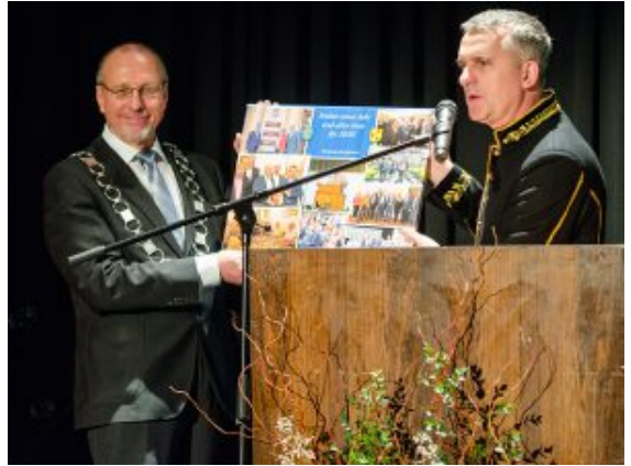
Ein persönliches Geschenk aus Wieliczka.