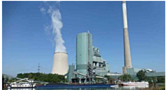
Das Steinkohlekraftwerk in Heil.

Der Bund will bis spätestens 2038 den Ausstieg aus der Braun- und Steinkohle geschafft haben. Für die vom Kohleausstieg tangierten Länder soll es 40 Milliarden Euro zur Gestaltung des Wirtschaftswandels geben, wie das Bundeskabinett heute beschlossen hat. Auch der Kreis Unna erhält Unterstützung.