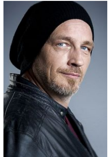
Torsten Sträter.

Torsten Sträter ist derzeit einer der populärsten Comedians. Der Mann mit der schwarzen Beanie mütze begeistert das Publikum mit seiner charmanten Präsenz und seinem feinem Gespür für alltägliche Absurditäten. Im Oktober dieses Jahres wird Torsten Sträter sein neues Programm in einer „Vorpremiere“ am 12. Oktober in Bergkamen vorstellen.