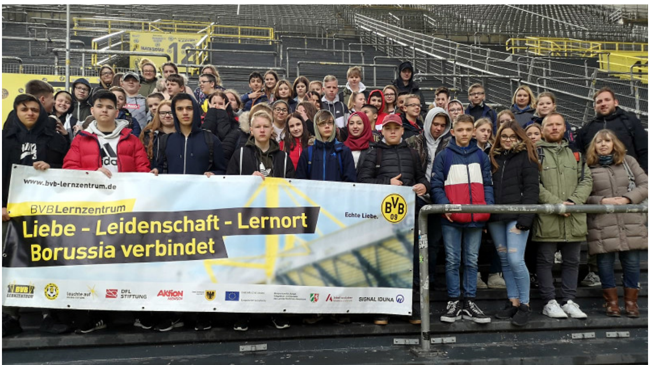
Die 7a und 8a im Signal-Iduna-Stadion.

Die Realschule Oberaden besuchte mit zwei Klassen das BVB-Lernzentrum im Signal Iduna Park. Im Rahmen dieser Veranstaltung nahmen die 7a und 8a an einem Workshop zu dem Thema „Zivilcourage“ teil, der durch das Fan-Projekt Dortmund e.V. angeleitet wurde.