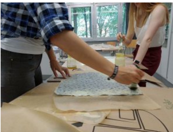
Herstellung von Bienenwachstüchern.

Am SV-Tag boten Schülerinnen und Schüler sowie Lehrkräften der AG einen Workshop an, in dem Bienenwachstücher hergestellt wurden – eine klimafreundliche Alternative zu Frischhaltefolie und Tupperware. Während des Workshops zeigte die Klima AG ihnen ein Film, der ihre Motive und Hoffnungen zum Klimaschutz darstellt. Die Aktion war ein voller Erfolg und wurde von Seiten der Schülerschaft mit großem Interesse belohnt.