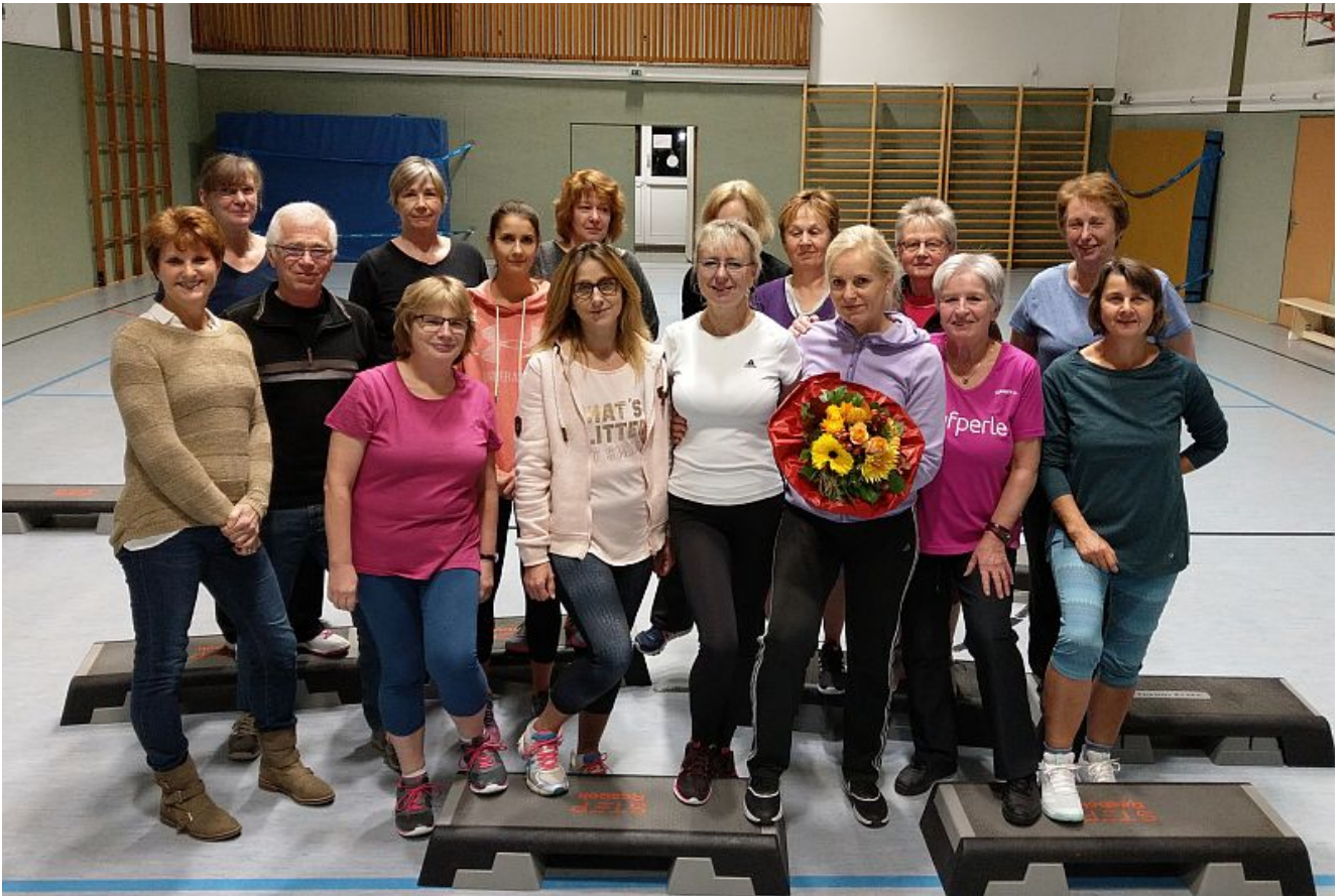
Der Step-Aerobic Kurs.

Zusammenarbeit. Wir wünschen ihr für die Zukunft alles Gute“, so der TuS Weddinghofen.