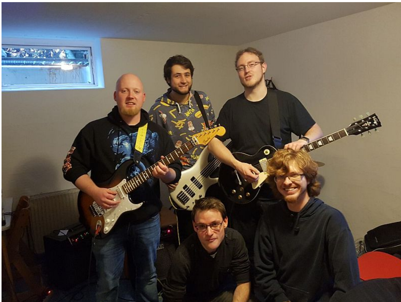
Power Word Kill Bild.

Get Loud For Youth Culture – Konzert im Yellowstone findet zum 10. Mal im Rahmen der landesweiten „nachtfrequenz 19“ – Nacht der Jugendkultur statt. Nach dem großen Erfolg der „Nacht der Jugendkultur“ im Rahmen der Europäischen Kulturhauptstadt RUHR.2010, und Ihrer Fortsetzung unter dem Motto „nachtfrequenz“ in den Folgejahren wird es am Samstag, 28. September, die zehnte Veranstaltung der Reihe geben. Neben Bergkamen nehmen Städte und Gemeinden aus ganz Nordrhein-Westfalen teil.