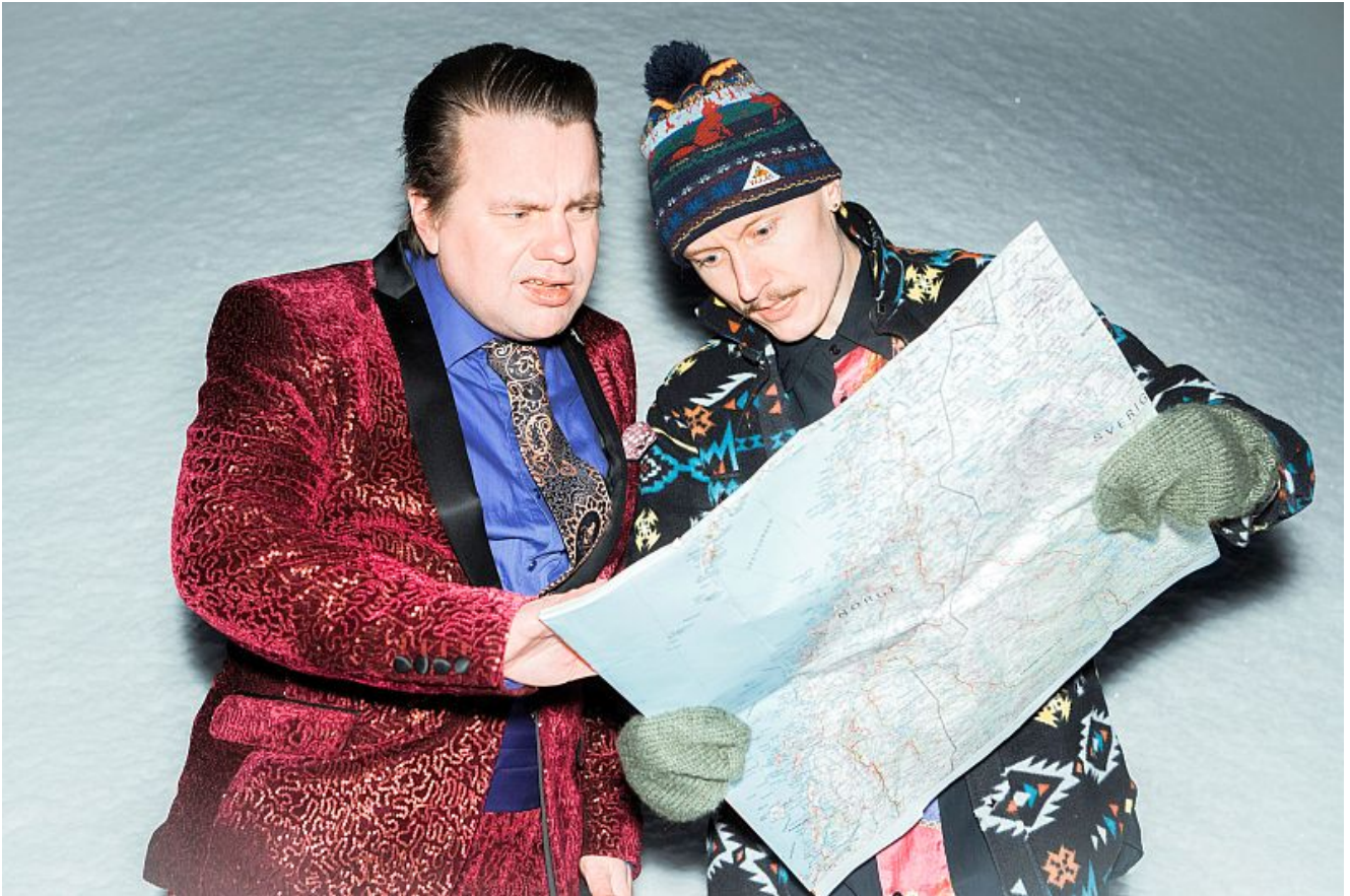
Das Lehtojärven-Hirvenpää Duo.

Das Lehtojärven-Hirvenpää Duo wird die Besucher mit gefühlvollem Gesang und Akkordeonbegleitung in die Welt des „FinnischenTangos“ entführen. In Zusammenarbeit mit der deutsch-finnischen Gesellschaft findet dieses Konzert am Montag, 21.10. um 19.30 Uhr im Trauzimmer Marina Rünthe in Bergkamen statt.