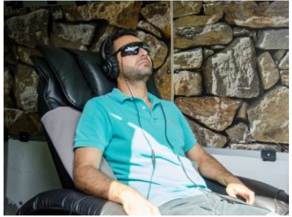
Entspannung im Massagesessel.

Ein Besucher machte es sich auf dem Massagestuhl bequem, ließ sich von den Lichtimpulsen in der Brille und den akustischen Signalen im Kopfhörer entspannen, bis der Sessel langsam in die Waagerechte glitt. Ein Entspannungsangebot, das „richtig gut tut“, bescheinigte der Besucher. Vor allem Firmen nutzen das Angebot für ihr betriebliches Gesundheitsmanagement, aber auch Privathaushalte. Angehende Immobilienbesitzer interessierten sich aber auch für die neuesten Gasbrennwertgeräte, die kabellos mit dem Heizkörper kommunizieren und via App vom Handy oder über ein Spracherkennungsgerät mit weiblichem Namen dirigiert werden können. Wenn das alles noch mit dem Rauchmelder und dem Lüftungsgerät verbunden wird, braucht fast kein Handschlag mehr getan werden, um die perfekte Raumatmosphäre zu erreichen.