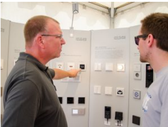
Smarte Ideen für die neue

Ein Besucher machte es sich auf dem Massagestuhl bequem, ließ sich von den Lichtimpulsen in der Brille und den akustischen Signalen im Kopfhörer entspannen, bis der Sessel langsam in die Waagerechte glitt. Ein Entspannungsangebot, das „richtig gut tut“, bescheinigte der Besucher. Vor allem Firmen nutzen das Angebot für ihr betriebliches Gesundheitsmanagement, aber auch Privathaushalte. Angehende Immobilienbesitzer interessierten sich aber auch für die neuesten Gasbrennwertgeräte, die kabellos mit dem Heizkörper kommunizieren und via App vom Handy oder über ein Spracherkennungsgerät mit weiblichem Namen dirigiert werden können. Wenn das alles noch mit dem Rauchmelder und dem Lüftungsgerät verbunden wird, braucht fast kein Handschlag mehr getan werden, um die perfekte Raumatmosphäre zu erreichen.