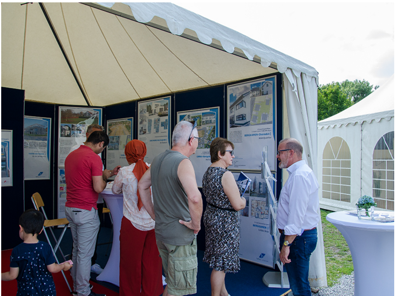
Beratung im Beta-Zelt.