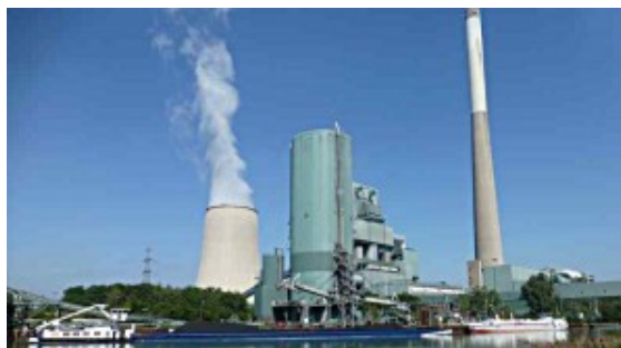
Das Steinkohlekraftwerk in Heil.

Der Bund will bis spätestens 2038 den Ausstieg aus der Braun- und Steinkohle geschafft haben. Für die vom Kohleausstieg tangierten Länder soll es 40 Milliarden Euro zur Gestaltung des Wirtschaftswandels geben, wie das Bundeskabinett heute beschlossen hat. Auch der Kreis Unna erhält Unterstützung.