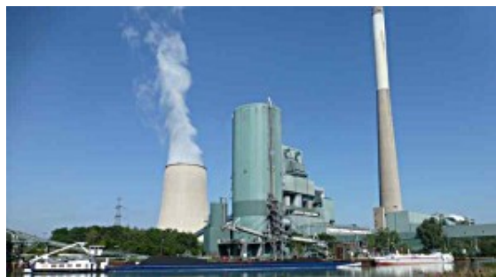
Das Steinkohlekraftwerk in Heil.

Der Bund will bis spätestens 2038 den Ausstieg aus der Braun- und Steinkohle geschafft haben. Für die vom Kohleausstieg tangierten Länder soll es 40 Milliarden Euro zur Gestaltung des Wirtschaftswandels geben, wie das Bundeskabinett heute beschlossen hat. Auch der Kreis Unna erhält Unterstützung.