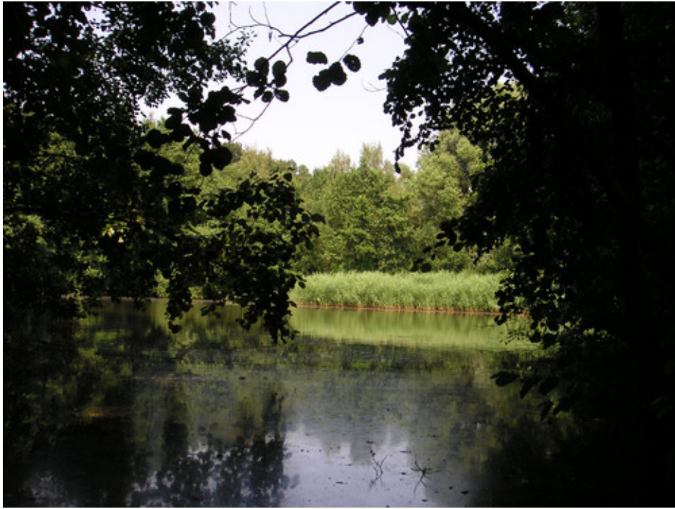
Gewässer im Mühlenbruch.

Am Donnerstag, 30. Mai, findet wieder die traditionelle Familienwanderung des NABU unter der Leitung von Udo Bennemann im Mühlenbruch statt.