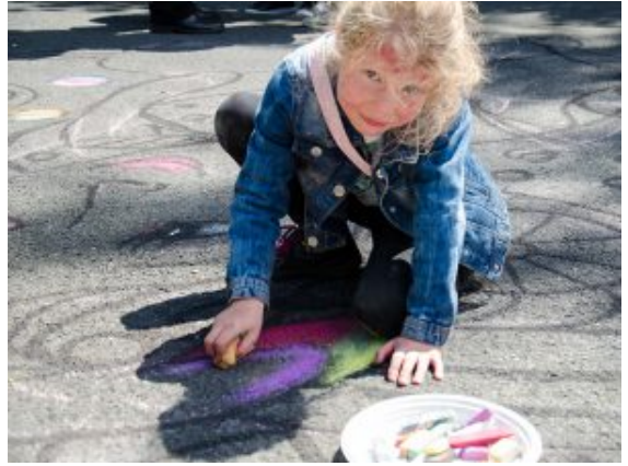
Engagierte Künstlerin mit der Kreide auf dem Asphalt.

Aus dem Staunen kamen die meisten ohnehin nicht heraus. Da wirbelte der Clown eben noch fünf Bälle durch die Luft, flitze dann mit dem Einrad herum und knetete dann in Windeseile aus einem Luftballon abenteuerliche Wesen. Wer am Würstchenstand verschnaufen wollte, dem war der Zauberer auf der Spur, mit unglaublichen Kartentricks. Auf dem Asphalt entstanden unter Kinderhänden knallbunte Fantasiewelten aus Kreide. Und direkt daneben raubte der Schnellzeichner die eine oder andere Illusion über das eigene Aussehen. Lachanfälle waren hier garantiert – nicht weniger beim Kinderschminken, das aus gerade noch harmlosen Gesichtern im nächsten Moment glitzernde Feen und Schmetterlinge zauberte.