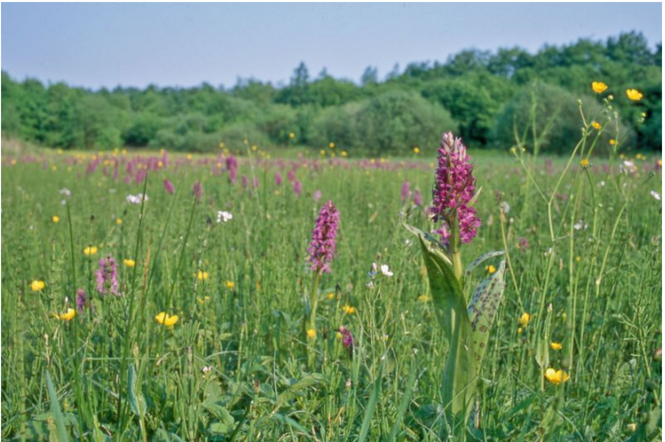
Breitblättriges Knabenkraut

Orchideen sind nicht nur Bewohner exotischer Gegenden – auch bei uns sind sie zu finden! Am Sonntag, 19. Mai, kann man mit dem NABU beispielsweise das Breitblättrige Knabenkraut entdecken.