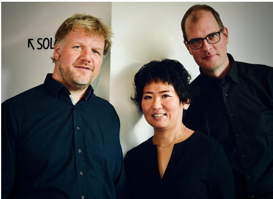
Trio BUCCINATE.

Im Programm des Jubiläumsjahres der Bergkamener Musikschule (1969-2019) stellen sich neben vielen Musikschülern und Musikschulensembles auch Dozenten der Musikschule in eigenen Konzerten vor. Für die nächste Jubiläumsveranstaltung dieser Art konnte neben dem Posaumentrio des Stv. Musikschulleiters Thorsten Lange-Rettich auch der bekannte Bochumer Kabarettist Jochen Malmsheimer gewonnen werden.