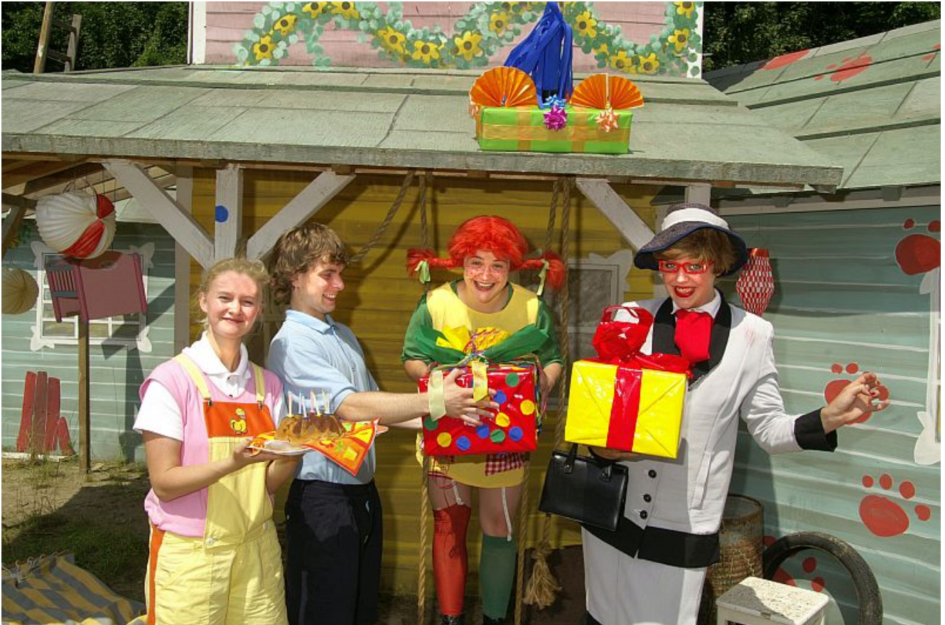
Pippi feiert im studio theater Geburtstag

Die Kindertheatervorstellung „Pippi feiert Geburtstag“ des Wittener Kinder- und Jugendtheaters am 27. Februar im studio theater ist bereits ausverkauft. Reservierte Karten sind am Eintritt hinterlegt und können dort ab 14.30 Uhr abgeholt werden. Beginn der Vorstellung ist um 15.00 Uhr.