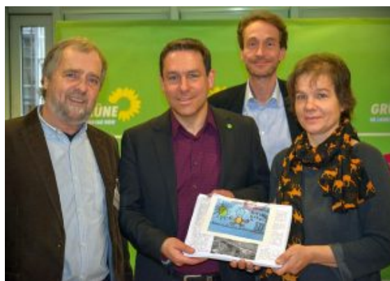
Übergabe der Listen mit den 3000 Unterschriften gegen