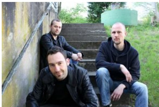
Me and Utopia.

der sich unter seinem Künstlernamen KonZ mittlerweile mit deutschen Texten durch die Szene groovt. Raus aus dem Yellowstone Proberaum direkt auf die Bühne geht es für die Band BoySetsCover, welche mit Coversongs aus den Bereichen Alternativerock, PopPunk und Melodic-Hardcore die Zuhörer fesseln wird.