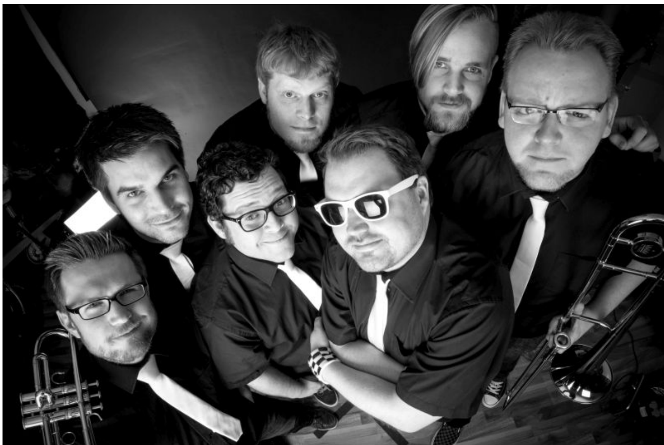
The Awesome Scampis.

Am Freitag, 5. Oktober, feiert das Jugendzentrum Yellowstone im Stadtteil Oberaden das 35-jährige Jubiläum der Einrichtung – und somit auch 35 Jahre engagierte und partizipative Offene Kinder- und Jugendarbeit in Bergkamen. Das Organisationsteam hat den musikalischen Fokus an diesem Abend bewusst auf lokale Bands und Künstler gelegt. So gibt es ein Wiedersehen mit vielen jungen und auch mittlerweile gereiften Musikern aus den letzten Bühnenjahren des Soundclubs.