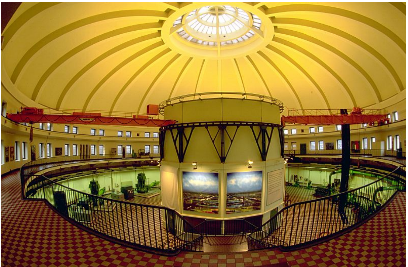
Das erste – und schönste – Pumpwerk (1914) der