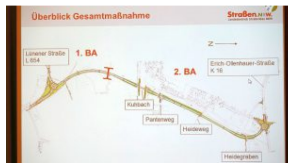
Zeichnerische Darstellung der L821n.

Substanziell Neues war von ihnen, aber auch von den Gegnern und Befürwortern des Straßenneubaus im Ausschuss und auf der gut gefüllten Besuchertribüne nicht zu hören. Es gab allerdings eine „Kleinigkeit“ in der Präsentation von Nölke und Aßmann auf den beiden großen Projektionsleinwänden nachzulesen, die niemanden so recht aufgefallen ist. Lief bisher die L821n bei Straßen.NRW unter der Bezeichnung „Ortsumgehung Bergkamen“ so lautet sie jetzt „Ortsumgehung Bergkamen-Oberaden“.