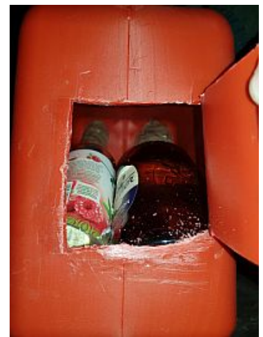
Glasflaschen mit flüssigem Amphetamin im Kanister.

Die Beamten der Kontrolleinheit Verkehrswege des Hauptzollamts Dortmund kontrollierten am 14. November gegen 19.00 Uhr einen Pkw mit polnischer Zulassung in der Anschlussstelle „Dortmund Lanstrop“. Der Wagen wurde auf der A 2 in Fahrtrichtung Hannover aus dem fließenden Verkehr gezogen.