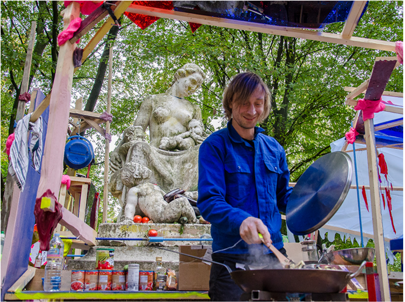
Kochen unter den Augen der „Mutter mit Kind(ern)“.