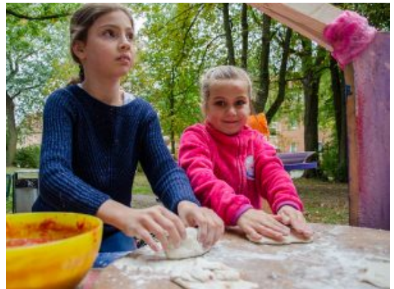
Zum Pizzabacken eignet sich das Besatzungslager auch hervorragend.

Gitarre wurde auch gespielt am Samstag kurz vor Abschluss der „Stadtbesetzung“. In einer riesigen Pfanne brutzelten die Auberginen, die gerade noch im Schoß eines der Steinkinder ruhten. In einem großen Kochtopf am selbstgezimmernten