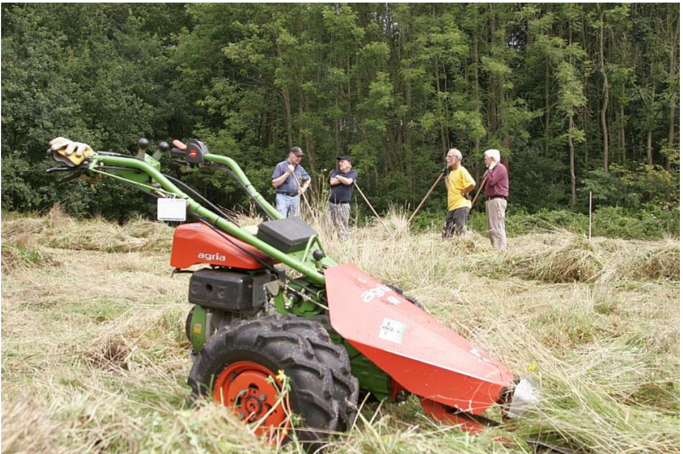
Wiesenmahd in Heil.

Am Samstag den 8. September ab 9.30 Uhr sucht der NABU Helfer beim Abtragen des Mahdgutes der Feuchtwiesen am Ende der Nördlichen Lippestraße in Bergkamen-Heil (hinter der Feuerwehr).