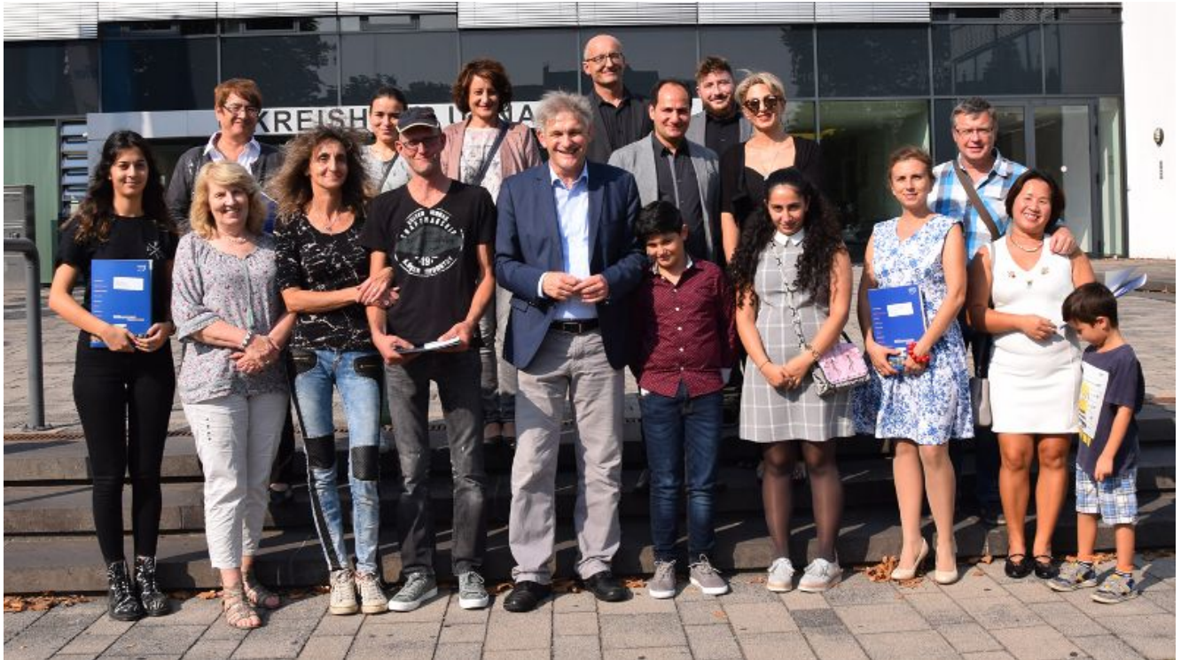
Landrat Makiolla mit den neu Eingebürgerten.

Bei einer Feier im Kreishaus Unna überreichte Landrat Michael Makiolla Menschen aus den unterschiedlichsten Herkunftsländern eine Einbürgerungsurkunde. Insgesamt 24 Personen erhielten bei der Veranstaltung am 4. September das für sie wichtige Dokument.