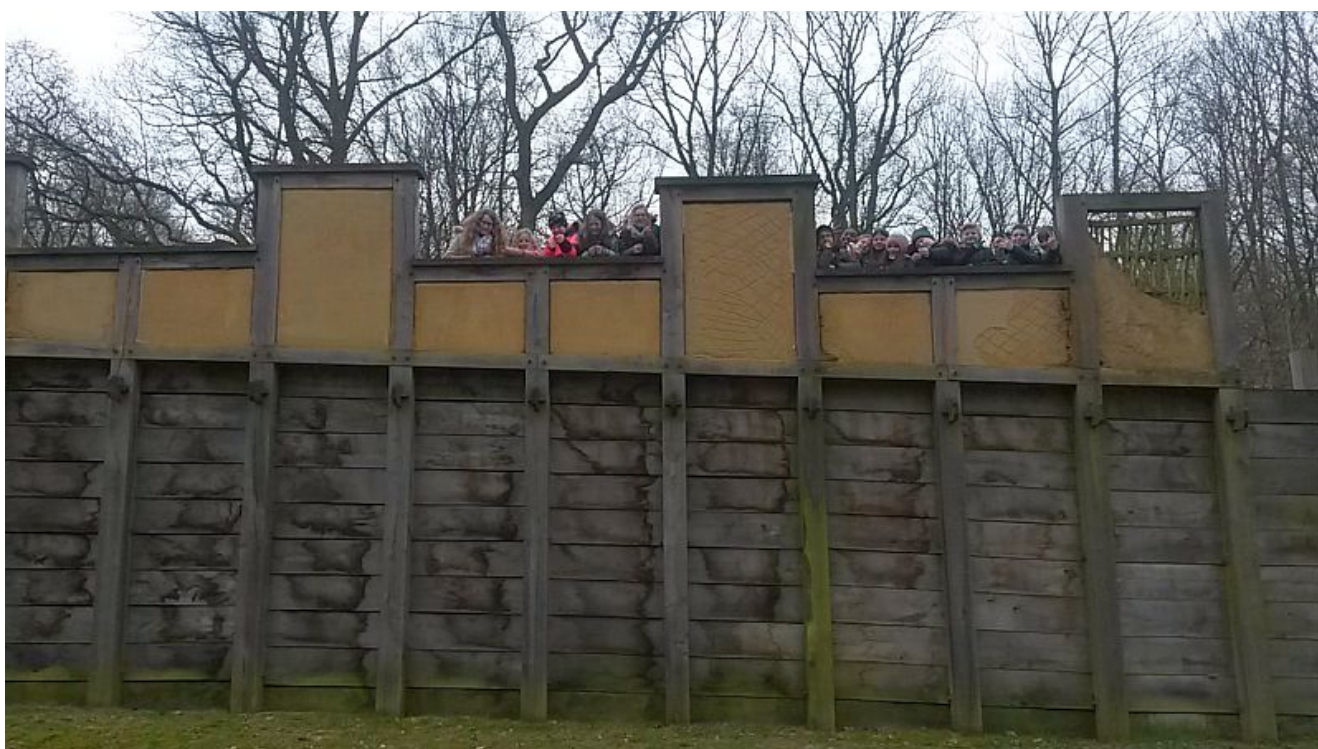
Verteidigung der Holz-Erde-Mauer.

Nach dem anschließenden Gewaltmarsch zurück zum Gymnasium ganz in der Manier antiker Legionäre mit Marschgepäck und im Stehschritt, waren sich alle einig: „Ein wirklich toller Tag!“, für den die 5a und ihre begleitenden Lehrer sich herzlich beim Stadtmuseum und seinen Mitarbeitern bedanken.