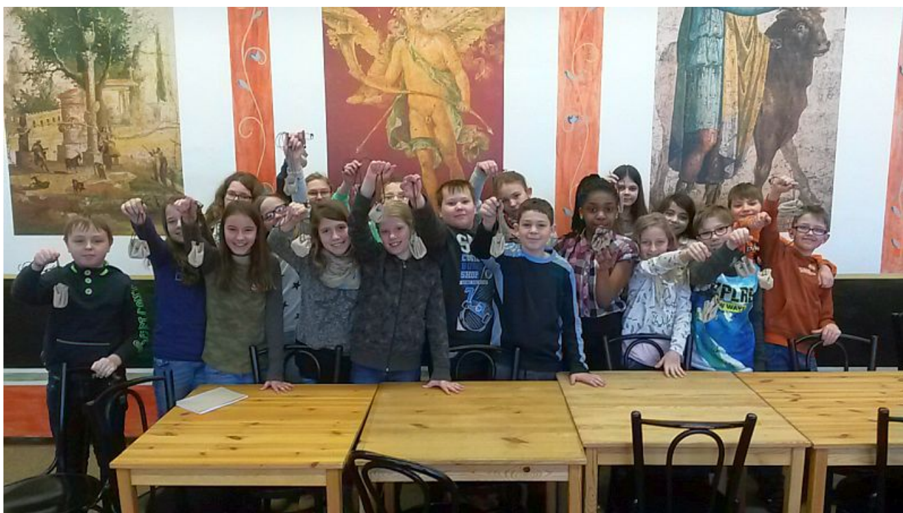
Spielebasteln im Stadtmuseum.

Auf einer eintägigen „Forschungsreise“ ins Stadtmuseum Bergkamen tauchte die Klasse 5a des Städtischen Gymnasiums Bergkamen in das Alltagsleben im Römerlager Oberaden ein.