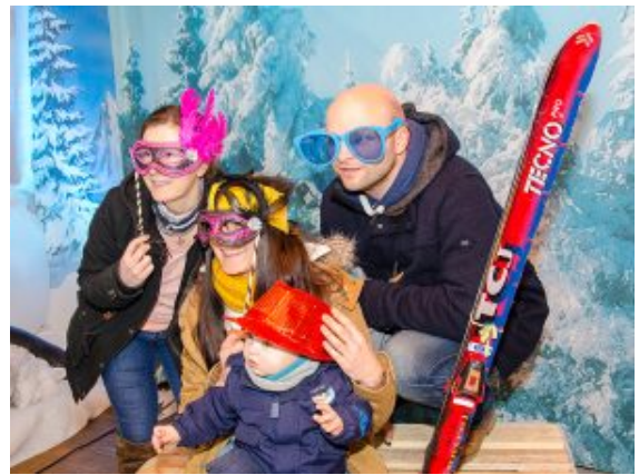
Fotospaß im winterlich-skurrielen Outfit in der Kinder-Winterwelt.