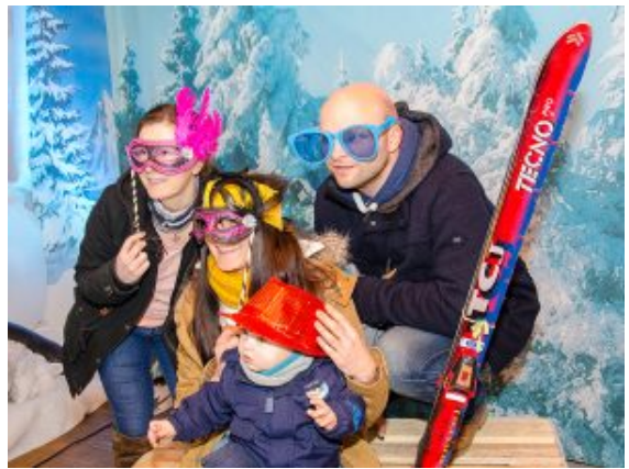
Fotospaß im winterlich-surrilen Outfit in der Kinder-Winterwelt.