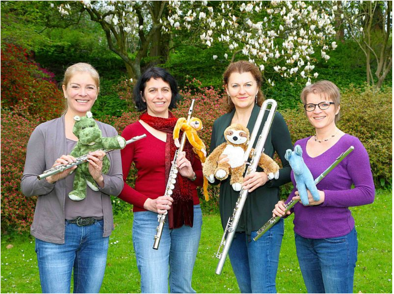
Das Bohème-Flötenquartett aus Dortmund.